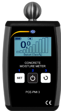
PCE-PMI 3 in menu modes.

The operating menu allows for changing alarm thresholds for the respective measurement scales and selecting at language. To access the operating menu, press and hold down the “SELECT MATERIAL” and “SELECT DISPLAY” buttons. Use the “SELECT MATERIAL” and “SELECT DISPLAY” buttons to navigate the menu. Use the “ON” switch to change menu levels and to confirm the settings. CAUTION! Critical parameters are protected against unintended modification with the use of an additional warning and request for confirmation. To navigate to the parent menu, press “Back” and briefly press the “ON” button. To exit to the main window, confirm the “Back” option of the top level menu.