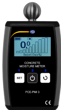
PCE-PMI 3 w trybie menu.

Menu obsługi służy do zmiany progów alarmowych dla poszczególnych skal pomiarowych, a także do wyboru języka. Aby wejść do menu obsługi, należy przytrzymać wciśnięte jednocześnie przyciski „SELECT MATERIAL“ oraz „SELECT DISPLAY“. Do poruszania się po menu służą przyciski „SELECT MATERIAL“ oraz „SELECT DISPLAY“. Włącznikiem „ON“ zmienia się poziomy menu oraz zatwierdza ustawione parametry. UWAGA: najważniejsze parametry są zabezpieczone przed niepożądanymi zmianami za pomocą dodatkowego ostrzeżenia i wymogu zatwierdzenia. Naciśnięcie przycisku „wróć“ (Zurück) i krótkie naciśnięcie przycisku „ON“ powoduje przejście do wyższego poziomu menu. Potwierdzenie opcji „wróć“ (Zurück) na pierwszym poziomie menu prowadzi do okna głównego.