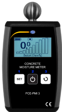
PCE-PMI 3 в режиме меню.

Меню позволяет изменять пороги срабатывания сигнализации для соответствующих шкал измерения и выбрать язык. Чтобы войти в рабочее меню, нажмите и удерживайте кнопки „SELECT MATERIAL” и „SELECT DISPLAY” одновременно. Для навигации по меню используйте кнопки „ВЫБОР МАТЕРИАЛА” и „ВЫБОР ДИСПЛЕЯ”. Переключатель „ON” изменяет уровни меню и подтверждает установленные параметры. ПРИМЕЧАНИЕ: наиболее важные параметры защищены от нежелательных изменений посредством дополнительного предупреждения и требования об утверждении. Нажатие кнопки „назад” и кратковременное нажатие кнопки „ON”. Приведут вас к более высокому уровню меню. Подтверждение опции „назад” на первом уровне меню приводит к главному окну.