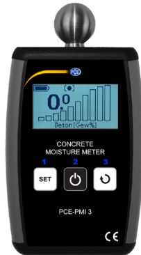
PCE-PMI 3 in menumodi.

Het bedieningsmenu maakt het mogelijk de alarndrempels voor de respectieve meetschalen te wijzigen en in taal te selecteren. Om het bedieningsmenu te openen, houdt u de toetsen „SELECT MATERIAL” en „SELECT DISPLAY” ingedrukt. Gebruik de knoppen „SELECT MATERIAL” en „SELECT DISPLAY” om door het menu te navigeren. Gebruik de schakelaar „AAN” om de menuniveaus te wijzigen en om de instellingen te bevestigen. LET OP: Kritieke parameters worden beschermd tegen onbedoelde wijziging door het gebruik van een extra waarschuwing en een verzoek om bevestiging. Om naar het bovenliggende menu te navigeren, drukt u op „Terug” en drukt u kort op de knop „AAN”. Om te verlaten naar het hoofdvenster, bevestigt u de „Terug” -optie van het hoofdmenu.